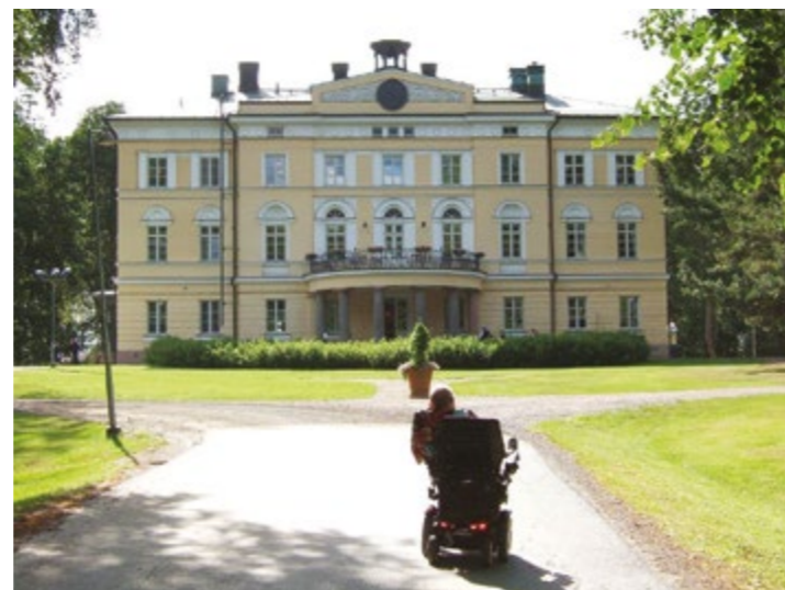
Vuojoen kartano.

”Kyl Raum on ain Raum” mielessämme ajelimme Raumalle. Olen itsekkin asunut siellä muutaman kuukauden lähes neljäkymmentä vuotta sitten. Kiertelimme ensin kaupunkia ja sitten bussi pysäköitiin Vanhan Rauman torin varrelle jäätelökioskin vierelle. Osa ryhmästä jäi istumaan kioskin lähituntumaan seurustelemaan keskenään, toiset tutustuivat alueeseen. Kaupat olivat suurimmaksi osaksi jo kiinni, mutta ei niihin asiaa