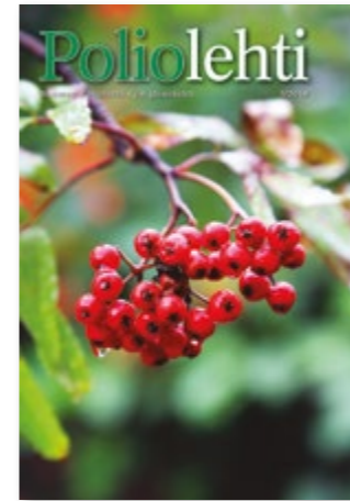
Kannen kuva AK