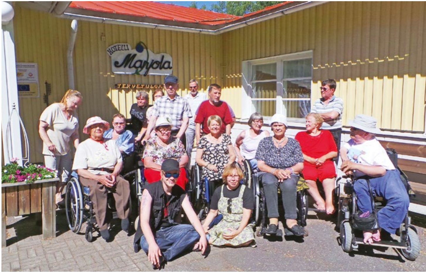
Terveiset kaikille Marjolan lomalaisilta.