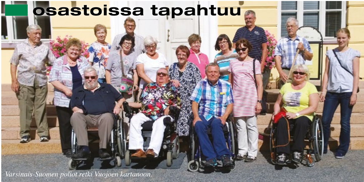
Varsinais-Suomen poliit retki Vuojoen kartanoon.