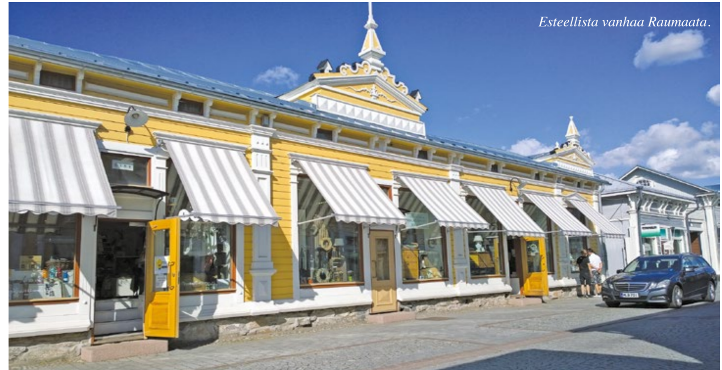
Esteellistä vanhaa Raumaata.

olisi ollutkaan huonojalkaisilla, eikä etenkin pyörätuolilla, niin esteellisiä ne olivat.