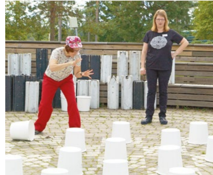
Annen pulma, missä se on?

Kiputiloja aiheuttavat muun muassa kudosisäryt ja hermovauriot.