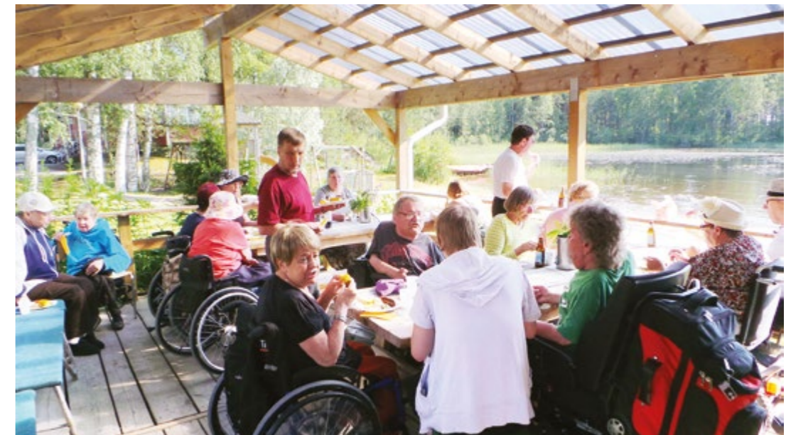
Mikäpä sopisi kesään paremmin kuin hyvä ruoka hyvässä seurassa ja auringonpaisteessa.