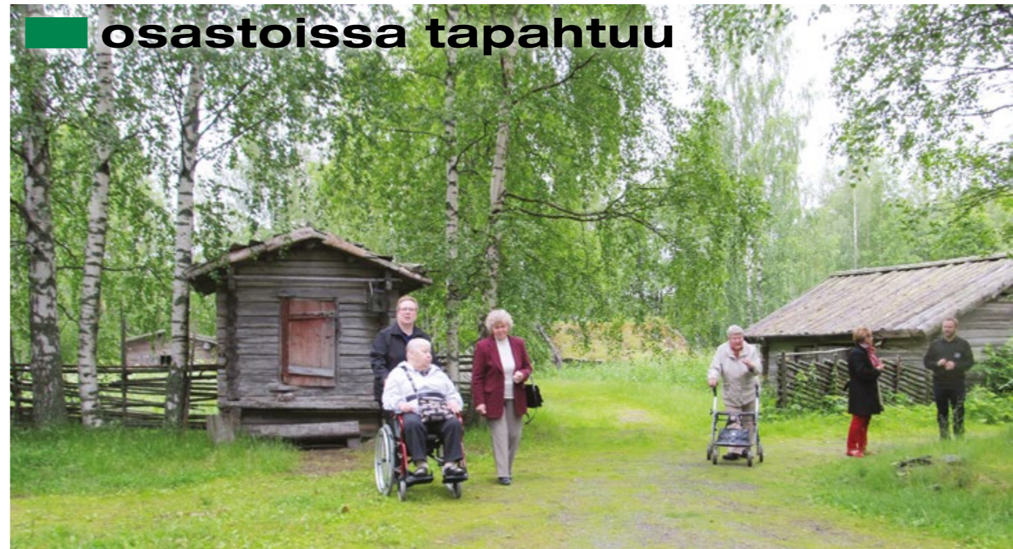
Iltapäivä Hevossalmessa oli kesäinen.