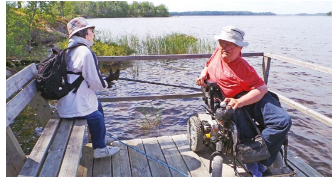
Topi ja salaperäinen kalakaveri.

Pidän erityisesti IC- junilla matkustamisesta, koska niihin pääsee pääsääntöisesti itsenäisesti. Ilman konduktöörin apua. Toisin kuin Pendolino juniin, joihin noustaan konduktöörin käyttämän nostolaitteen avulla. Mutta ongelmana ylitse muiden niin IC-, kuin Pendolino junissa on pyörätuolipaikkojen saavutettavuus. Junarungoissa on satoja tavanomaisia istuma-