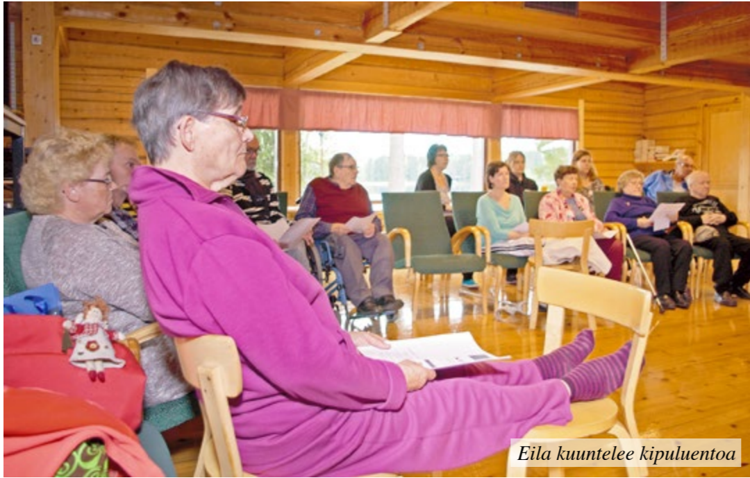
Eila kuuntelee kipuluentoa