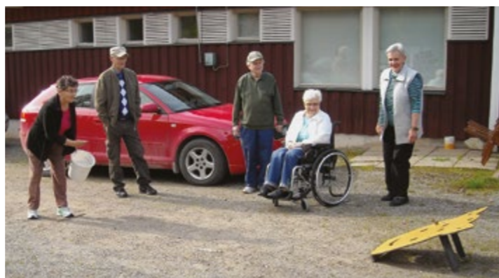
Parviaisen Eilan vuoro koittaa saada ketjuja putoamaan reikiin.