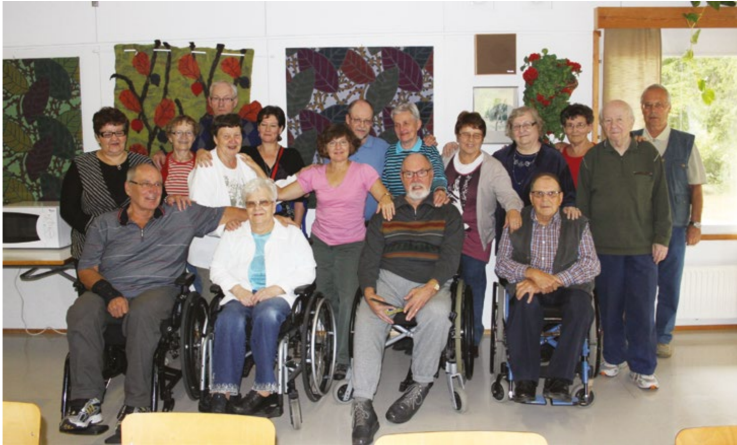
Pohjanmaan osaston parikymmentä henkilöä pitivät mukavan syyspäivän juttelun ja pelailun merkeissä.

Kun allekirjoittanut saapuu Pohjanmaan osaston syystapahtumaan Ilmajoen kunnan leirikeskukseen, vastaanotto on tosi iloinen, josta kirjoittaja myös liikuttui. Minua oli odotettu.