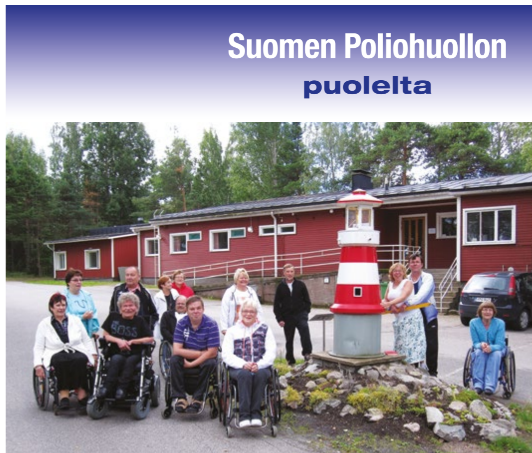
Suomen Poliohuolto ry:n jäsenilleen tarjoama vertaistukitoiminta kiinnostaa vuodesta toiseen. Tälläkään kertaa ei varattuja paikkoja jäänyt käyttämättä.

Kulun kesä ja meillä on ollut syksy ovat olleet jälleen yhdistyksemme vuotuisen toiminnan vilkkainta aikaa. On ollut ilolla merkille pantavaa se innostus, jolla jäsenistömme viettämään yhteistä joulujuhlaa 24.11.2012 klo 18.00 alkaen Teatteriravintola Nyyrikissä Helsingissä.