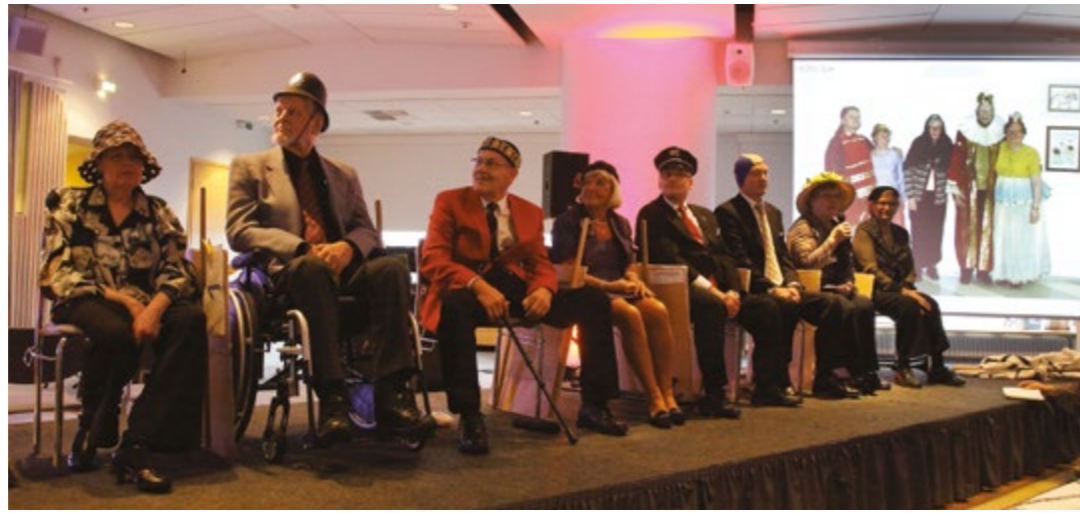
Teatteriryhmä P.Ä.S.P.Ö kertoi viihteellisesti osastonsa viimeisimmän kymmenen vuoden toiminnasta.

Kesäteatterireissuilla ja Hevosalmen kesätapahtumissa näytti