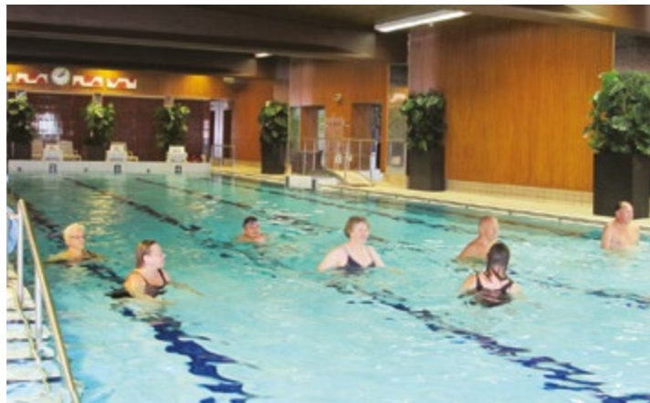
Altaalla Velma tiesi kuinka saada liikettä aikaan.

Ruokanokosten jälkeen pulahdimme pienelle vesijumppa-keikalle ja pikaisesti vierailimme tosi kylmässä vesialtaassa. Jää-