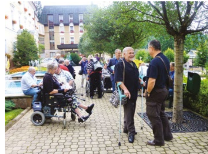
Janske Laznen kylpylän edessä keskusteltiin vilkkaasti polioon ja Epuun liittyvistä asioista, unohtamatta naurua ja hyvää yhteishenkeä.

kokousedustajien mielipidetä puheenjohtajasta, vaikkakin heillä itsellään oli päätösvalta. Nähtäväksi jää onko ensi vuoden sääntömuutosehdotusten listalla myös puheenjohtajan va-