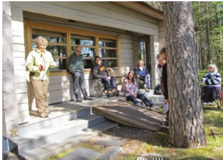
Savolaiset järjestivät kuntoutuksen lomaan oikeat omat olympialaiset.

hileetkin veden pinnalla olivat noin 28 asteisia. Henkilötkin olivat kylmävesikeikan jälkeen selvästi hieman kutistuneet.