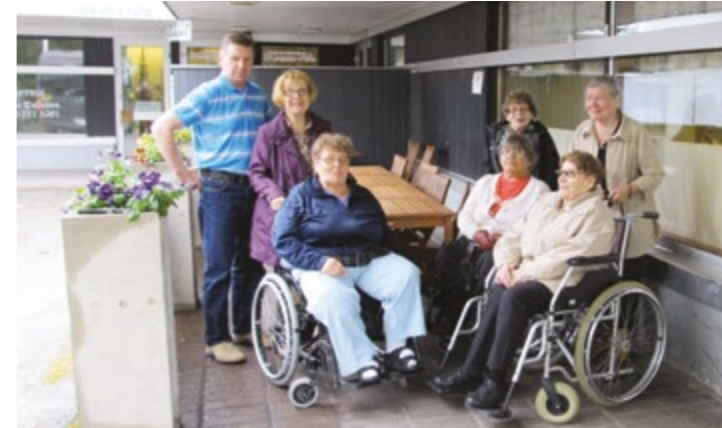
Retkiporukka viihtyi myös Lapinlahdella (alakuva).

lijoiden eri materiaaleista, jopa hauskojakin luomuksia. Tämän jälkeen pistäydymme paikallisessa ravintolassa nauttimassa maittavan aterian.