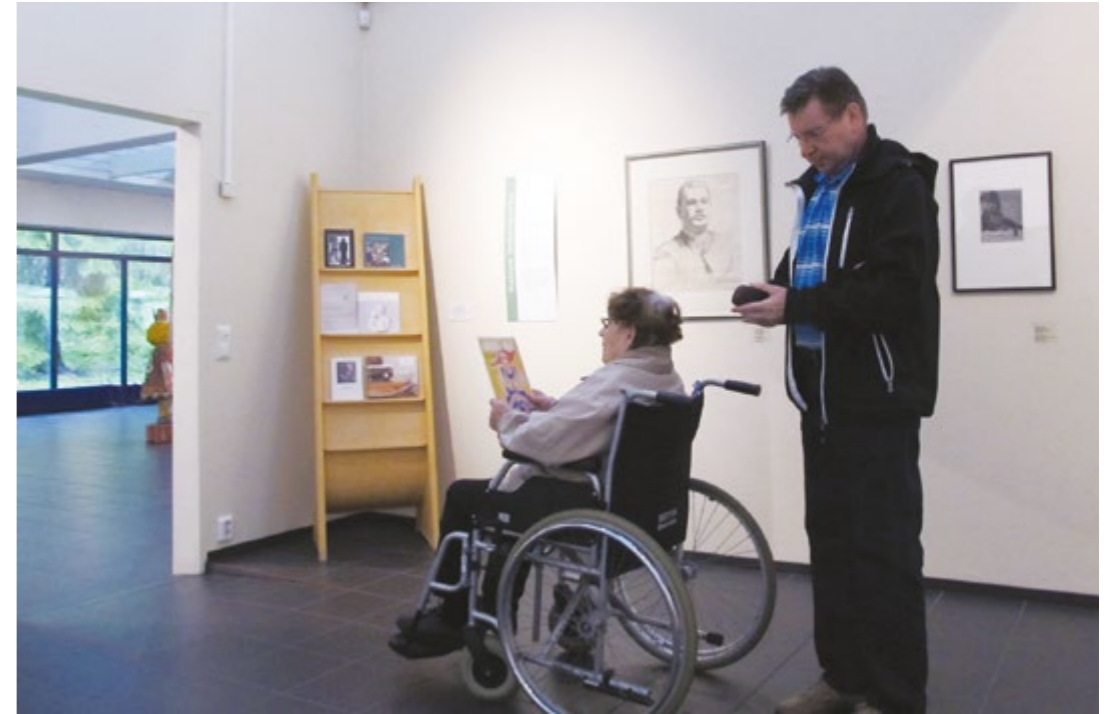
Savon osaston retkeen kuului vierailu Pekka Halosen museossa (yläkuva).

Jatkoimme matkaa toiseen kulttuurikohteeseen, taidemuseoon, jossa oli esillä Itetaitei-