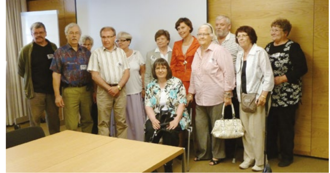
Varsinais-Suomen osastolaiset kävivät tutustumassa Pääkaupunkiin.

Valtiosalissa kuulumme tietoa eduskuntatalosta. Valtiosali on paikka, jossa yleensä kuvataan erilaisia kansanedustajien ja ministerien haastatteluja. Se tuntui heti tutulta. Hissillä menimme 3. kerrokseen, jossa sijaitsevat yleis- ja medialehteri sekä ympäristö- ja puolustusvaliokunnan kokoushuoneet että erilaisia työ- ja ryhmätiloja. Istuimme yleisölehterillä katsellen tyhjää istuntosalia ja kuunnellen oppaan kertomia asioita. Pitkään niissä penkeissä ei olisi halunnut istua, sillä tuoli ei ollut niin mukava.