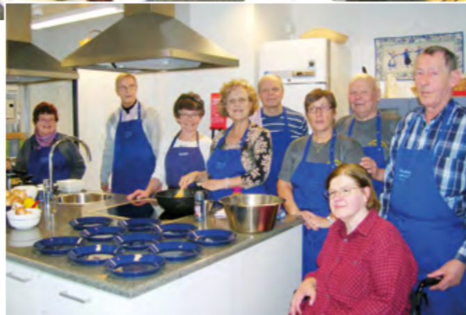
Marttojen Thai-ruokakurssi keräsi joukon tamperelaisia hyvän ruuan ääreen. Yhdessä tekeminen maistuu aina.