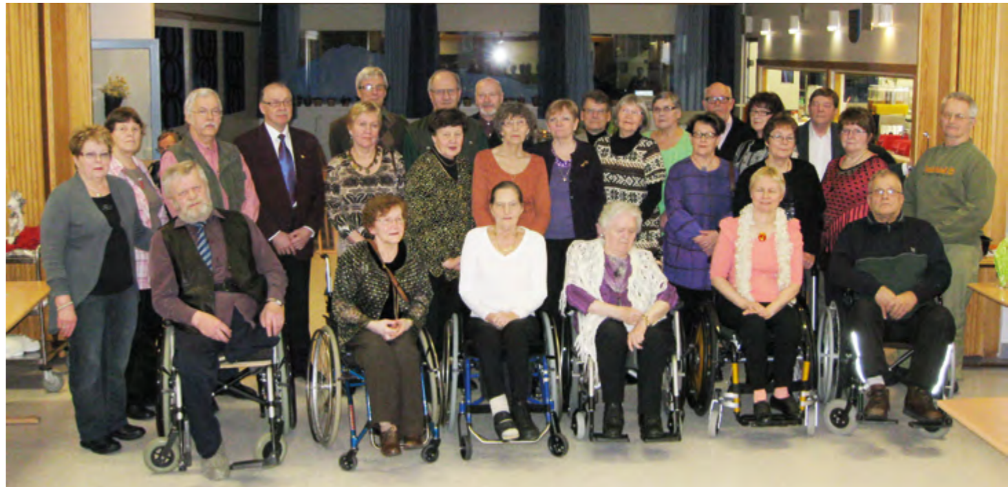
Kurssilaiset perinteisessä ryhmäkuvassa.

Aamupalan jälkeen oli kaikkina arkipäivinä luentoja eri aiheista. Luennot painottuivat sosiaalietuuksiin ja esteettömyyteen. Joidenkin luentojen suhteen oli ehkä turhaa toistaa. Ihmiset olivat aktiivisesti mukana, jopa niin, että esim. psykologi Halosella oli vaikeuksia pysyä aiheessaan, kun osallistujat halusivat kertoa vaivoistaan ja kokemuksistaan. Uutta tekniikkaakin kokeiltiin, kun päästiin skypen avulla virtuaalikierrök-