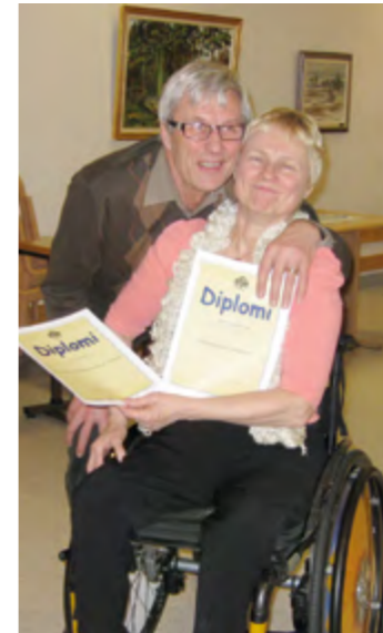
Kurssidiplomit saavat saajansa hyvälle tuulelle.

Mietimme mitä muita retki-kohteita lähiseudulla voisi olla. Pohjanmaalla on tunnetusti isoja maatiloja. Itselleni ainakin olisi elämys tutustua nykyaikaiseen navettaan ja kuulla mitä maatilalla tänä päivänä tapahtuu, jos ei EU:n hygieniavaatimukset sitäkin asiaa estä.