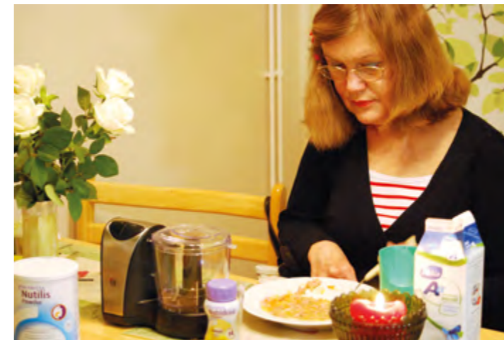
Nielemisongelmiin yksi käytännön ratkaisu on soseuttaa ruoka valmiiksi ennen ruokailua.

Samana päivänä tunnin päästä soitti toisen terveysaseman lääkäri ja kertoi lähettäneensä tutkimuspyynnön nielu ongelmistani Kaupunginsairaalaan. Aika tuli nopeasti. Kaupunginsairaalan kurkku- korva- ja nenälääkäri ihmetteli, miksi minut on lähetetty hänen vastaanotolle, eikä suoraan tyks:iin. Hän kyllä katsoi nieluani ja totesi sen saman kuin minäkin joka päivä, yökkäysrefleksi ei toimi. Hän katsoi myös korvat ja otti vaikon pois. Naurettiin yhdessä, että olihan tästä se ilo, että tuo vaikko saatiin pois. Lähetetäni tyks:iin ja videokuvauksen nielun toiminnasta. Kuvauksessa todettiin, että ruokaa jää taskuihin (poimuihin), jotka ovat kurkun päässä. Sen olin tuntenut ruokailllessa. Ruoka jää ikään kuin kiinni kurkunpäähän. Ei mene alemmaksi eikä tule enää pois, kun ei ole yökkäysrefleksiä. Varjoainetta nousi myös nenänielun puolelle yhdessä nielaisessa. Sen tiesin, koska nestemäinen ja löysempi ruoka saattaa tippua nenästä ulos. Se tuntuu kamalalta, jos