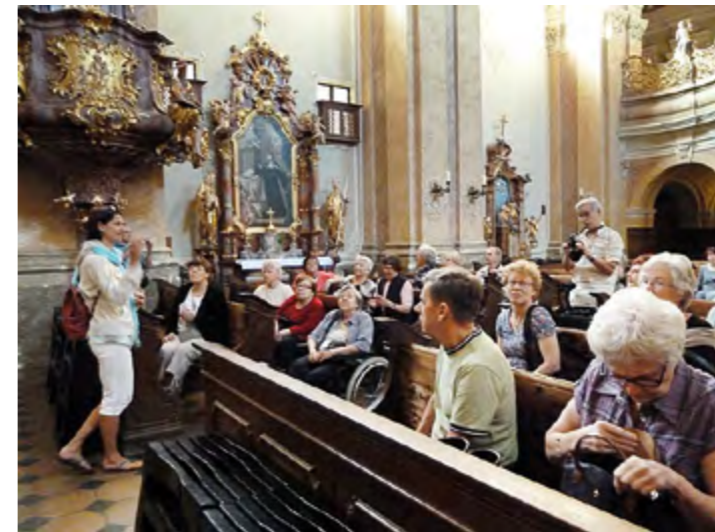
Benediktiiniläisluostarin kirkko Balaton-järvellä.

ja, joista tehdään Unkarin parhaimmat valkoviinit. Teimme lyhyen kaupunkikierroksen ja ajoimme viinitilalle viininmaistajaisiin. Lähes jokainen osti tilalta tuliaisia. Kun lähdimme viinitilalta ravintolaan syömään, oli jo aivan pimeää. Palasimme hotelliin ja saimme nukkua, vaikka huoneessa oli helpeistä.