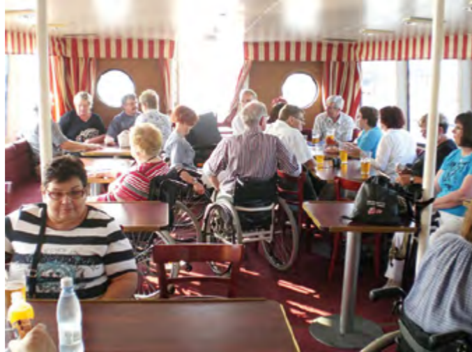
Matkalla Vepsän saareen.

lä. Kirkon kuoriosan kautta pääsee kävellen portaille, jotka vievät linnan hienoimpaan juhlasaliin. Otin kynnärsauvat käyttööni ja kävin samalla arvioimassa soveltuuko sinne johtava ruuankuljetuksiin tarkoitettu reitti