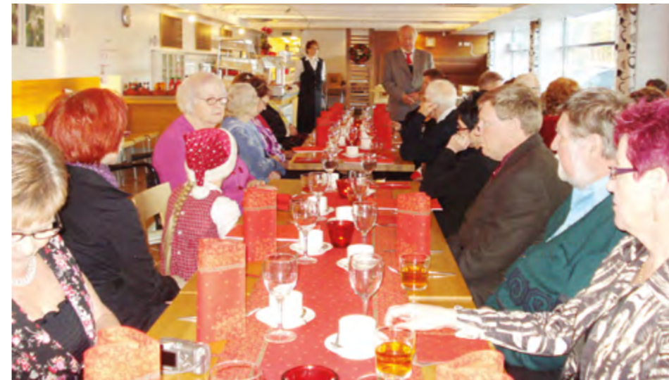
Satakuntalaiset kokoontuivat pikkujoulun viettoon Raumalle.

Satakunnan osaston osastolaiset ovat pulikoineet ahkerasti altaassa, ohjatussa vesivoimistelussa kerran viikossa. Torstaikerhossa on kerran kuukaudessa vaihtelevasti näpperlehty askarrellen jotain pientä, välillä tuolijumppa, vaihdettu kuulumisia ja kokemuksia kahvikupposen ääressä.