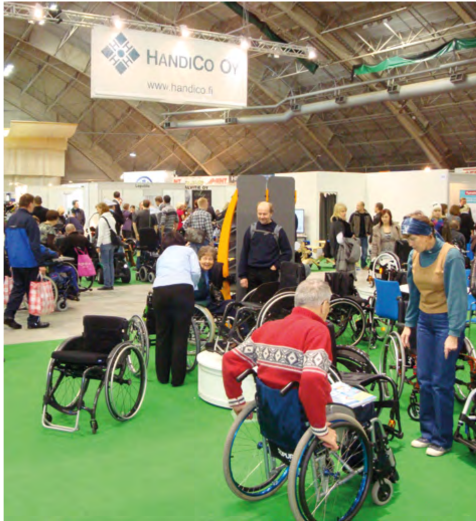
Apuvälinemessut oheistapahtumineen keräävät tuhannet käyttäjät ja ammattilaiset yhteen ammentamaan alan uutta tietoa ja tutustumaan käytännössä apuvälineisiin.

- Mielestäni on tärkeää, että myös maksajatahot tutustuvat apuvälinemessuihin. Apuvälineen hankinta on aina yksilöllinen prosessi. Terveystieteiden kilpailutetaan apuvälineen tarjoajia. Kilpailutus ei aina ole järkevää. Peräänkuulutan harkinnanvaraisuutta apuvälinepalveluiden kilpailuttami-