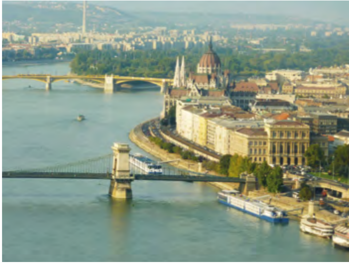
Budabest on kauniiden siltojen kaupunki.

Hotellimme sijaitsi aivan Vanhankaupungin läheisyydessä, mutta kuski ei ajanut hotellille, koska hän olisi joutunut rikkoamaan sääntöjä. Näin ollen me pyörätuolia käyttävät jouduim-