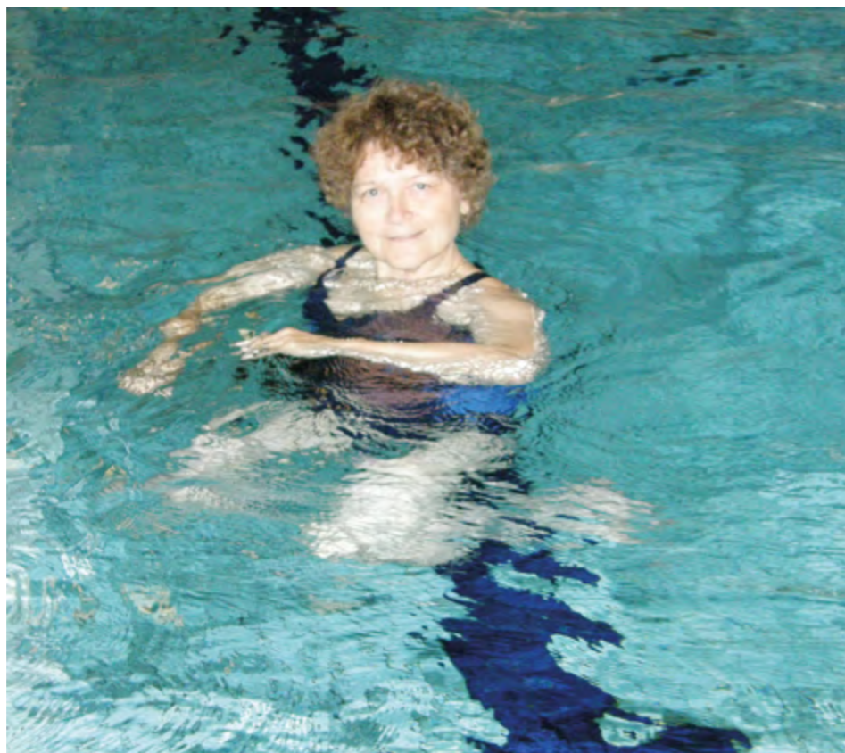
Suomessa lämminvesivoimistelu on yleinen terapiamuoto.

Tutkimuksen perusteella yli 80%:lla polion sairastaneista oli elimistössään jäänteitä poliovirusten perimästä eli epätäydellisiä poliovirusia, kun taas vertailuryhmien elimistöstä näitä löytyi vain 3%:lla. Tämä löydös osoittaa, että epätäydelliset poliovirukset