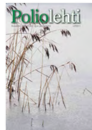
Kannen kuva AK