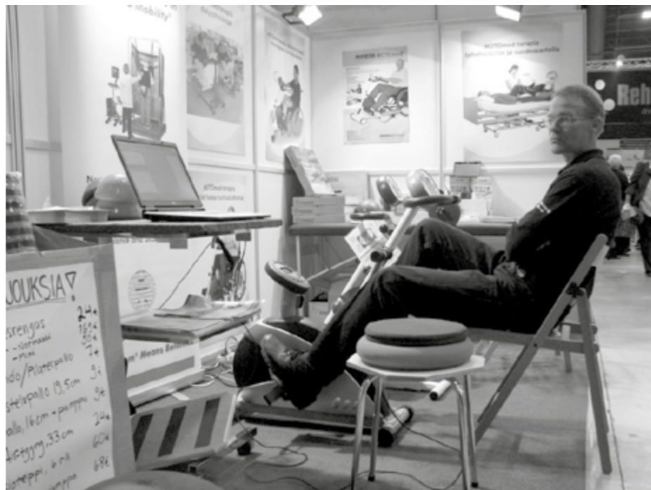
Hyvä Ikä-messut tarjosivat myös omaehtoisia kunnan hoitamisen välineitä.