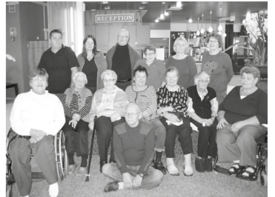
Savolaiset kokoontuivat pitämään huolta kunnostaan Kruunupuistoon jo toista kertaa. Hekukurssit jatkuvat myös ensi vuonna.