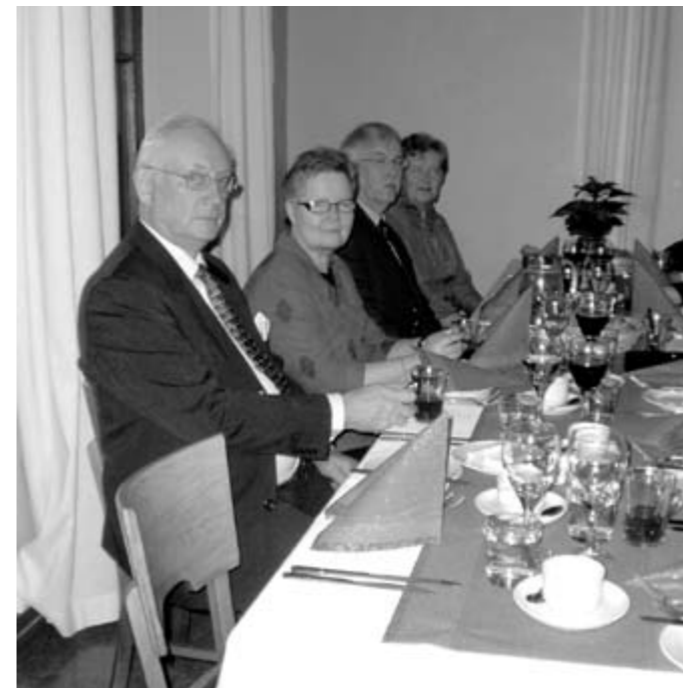
Tuomolat ja Jokiset.

tuli 40, mikä on hyvä saavutus näin isossa joukossa.