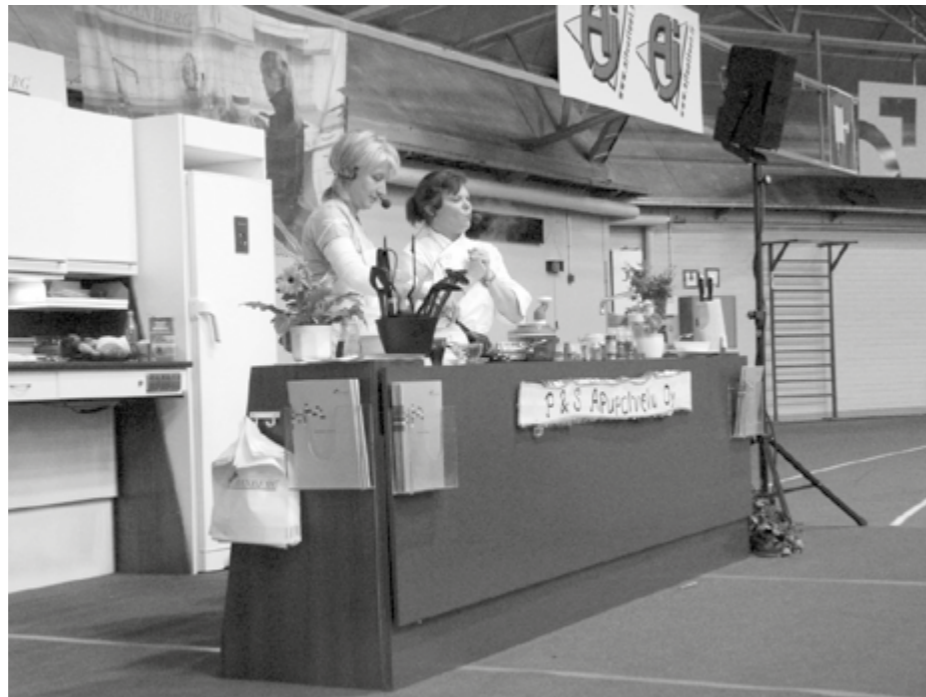
Hyvän ruuanlaiton opastusta oli niin ikään messuilla tarjolla.

- Mahdollisuuksia on. Suunnitellaan elinympäristö esteettömäksi, tarjotaan