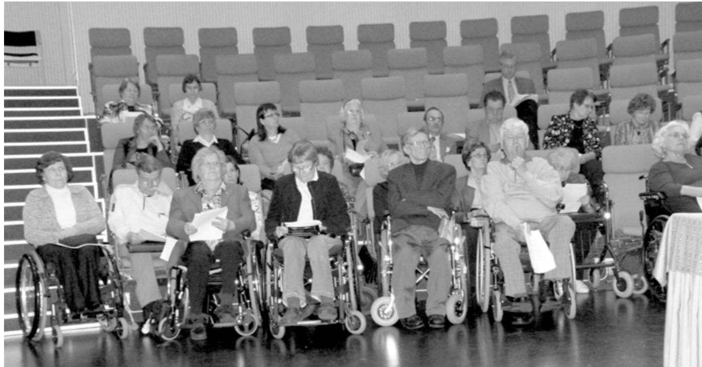
Polioinvalidit ry:n vuosikokousosallistujia vuodelta 2008.