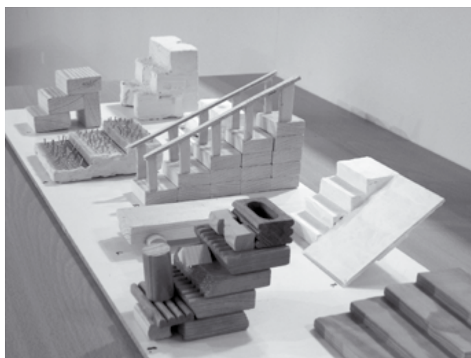
Ruskeasuon koulun oppilaat tarkastelivat esteettömyyttä portaiden näkökulmasta.

tuksi jäämisestä ja toinen kuva hyväksymisestä.