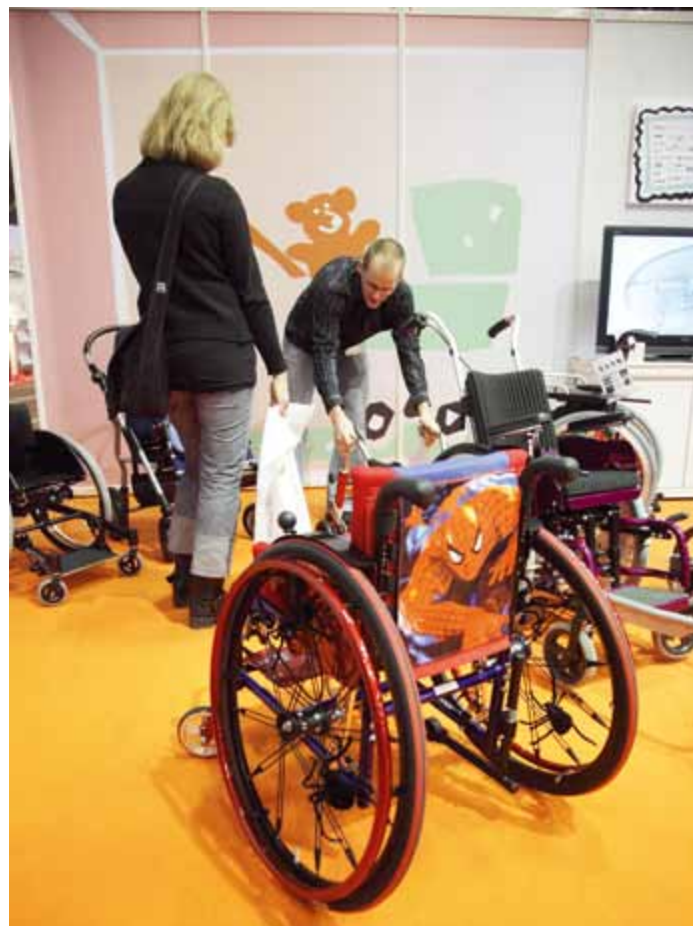
Tyylikkäästi tuunattu hämähäkkimies-tuoli.

muassa apuvälineet suurelta osilta tulevat juuri näiden talouskriisissä olevien kuntien maksamina.