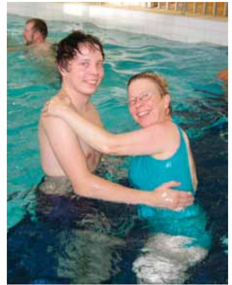
Helenalla on vientiä.