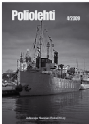
Kannen kuva AK