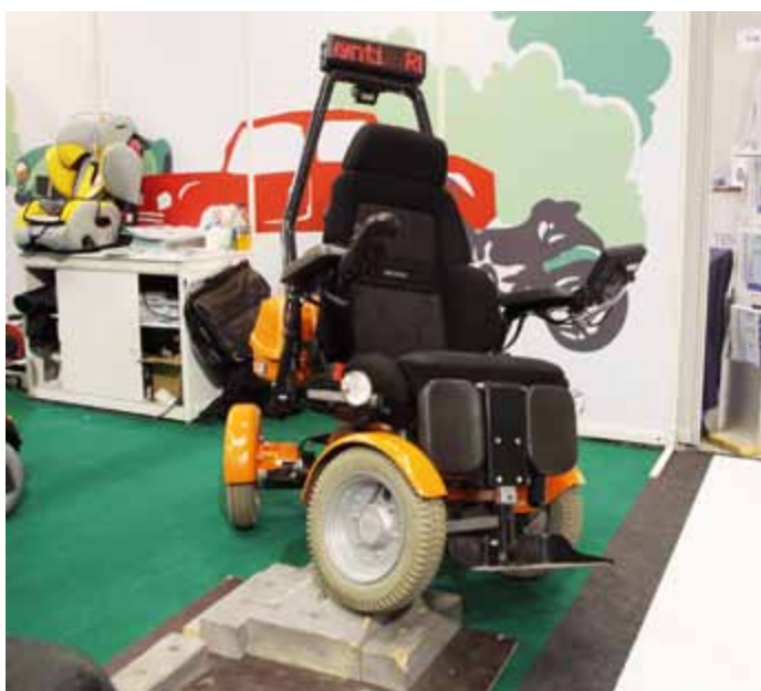
Maastokelpoinen sähkökäyttöinen sähkökärry.