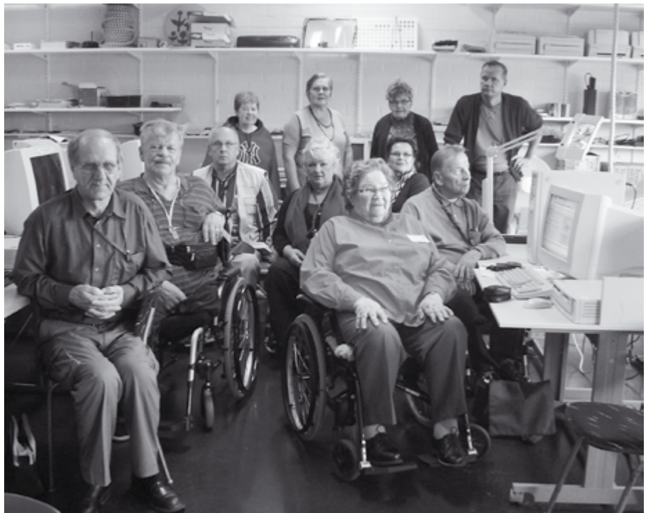
Koskaan ei ole liian myöhäsiä oppia jotakin uutta, tietävät ainakin kaikki atk-perusteisiin tutustuneet kurssilaiset.

- Opettajat osaavat kannustaa ja tutustuttaa kurssilaisia tietokonemaailman saloihin. Ihan tavallisella suomenkie-