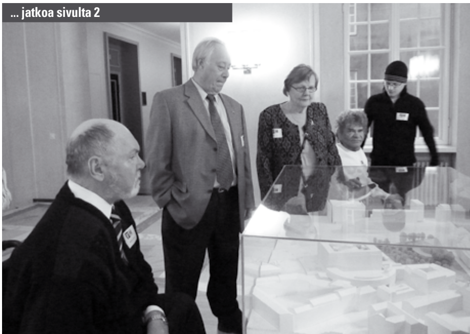
Eduskunnan rakennukset pienoismallina kertovat, kuinka monimutkaisesta rakennuskokonaisuudesta onkaan kysymys.