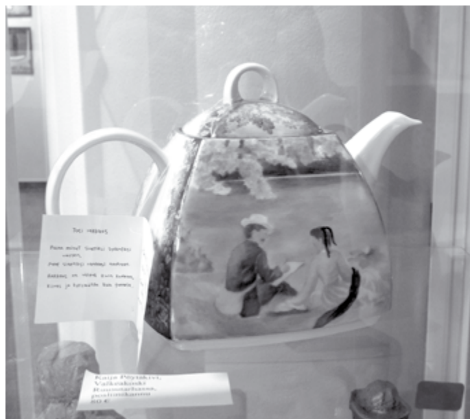
Voiton kilpailussa Kaija Pöytäkivelle toi teekannu, joka herätti taide-maalari Warin mielessä hyvän kokemuksen tunteita.

- Jokainen ihminen pitää hyväksyä sellaisena kuin on ja myös hyväksyä itse itsensä. Eikä saisi jäädä ulkopuolelle, vaan ottaa kaikki mukaan, kertoo Leena Pajunen työssään jossa ensimmäinen kuva kertoo kiusaamisesta ja kiusa-