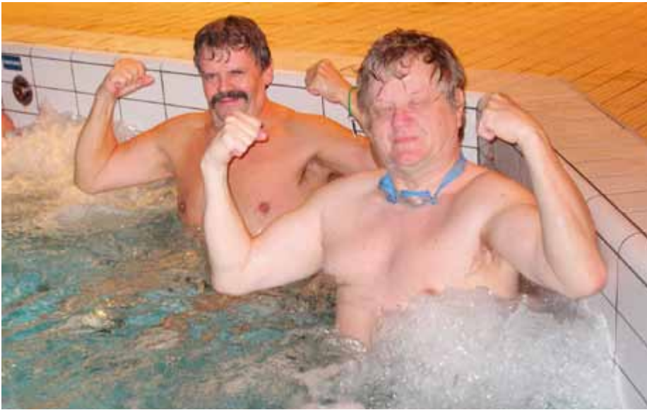
Sitä vaille mitä puuttuu.