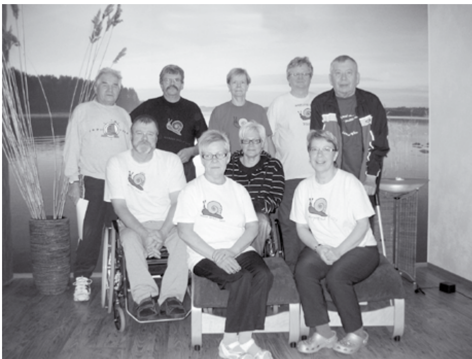
Harjun Hitaat 2009.