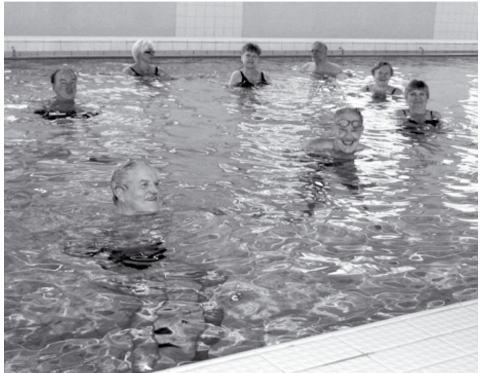
Ortonin allas täyttyy torstaisin pääkaupunkilaisista poliovammaisista. Heille yksi oman hyvinvoinnin ja jaksamisen tuki on säännöllinen ja ohjattu vesivoimistelu.

Uintipaikaksi valittiin Orton säätiön uima-allas. Altaaseen on hissi ja tilat muutoinkin kohtuulliset.