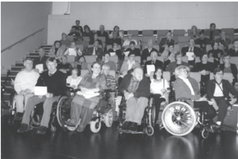
Polioinvalidit ry:n vuosikokoukseen osallistui 115 yhdistyksen varsinaista jäsentä.