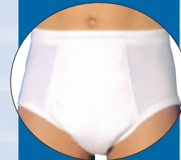
Miesten koot 46-62