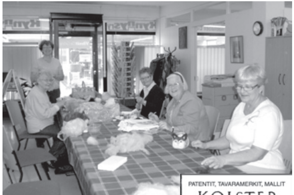
Jokainen osaa askarrella.

Tämän jälkeen olemme maalanneet pärekoreja ja niihin kuvioita pintaan. Hauskaa oli, kun huomasimme, että kaikki olivat valinneet maalikseen vihreän ja kolmella vielä samaa sävyä. Maalivärejä kaupassa oli kymmeniä. Olemme pyrkineet ottamaan kuvia töistä ja tunnetustihan kuvat kertovat enemmän kuin sanat.