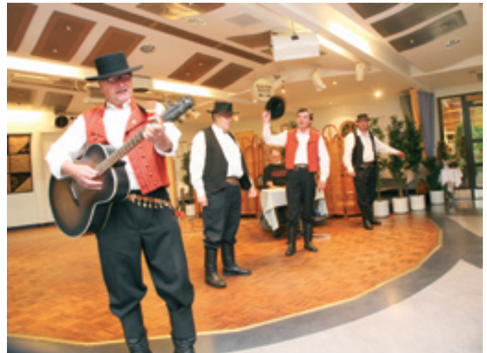
Häijyt olivat ne komiat miehet.