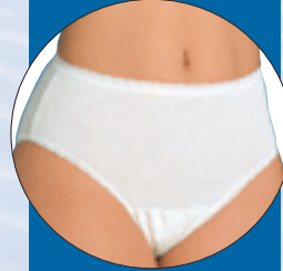
Hygienia-asu naisille koot 38-52