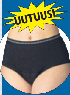
Värit: valkoinen tai musta koot 34-56