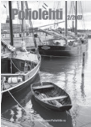
Kannen kuva: AK Ahvenamaalaiset Helsingissä