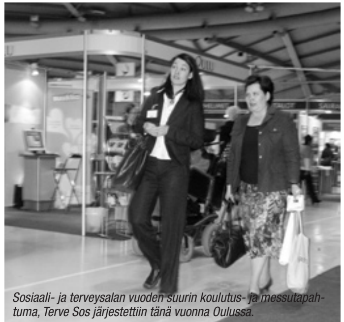
Sosiaali- ja terveysalan vuoden suurin koulutus- ja messutapahtuma, Terve Sos järjestettiin tänä vuonna Oulussa.

- Uusi hankintalaki saattaa lainsäädännön vastaamaan entistä paremmin tämän päivän tarpeita, tehostaa jul-