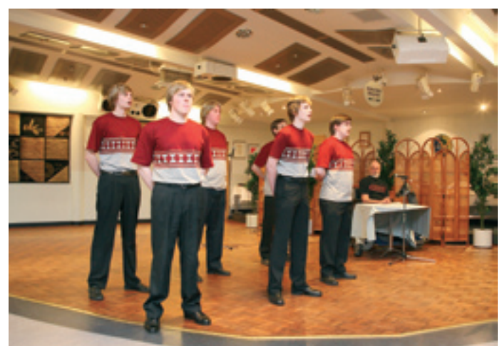
Rysköö-remmi lausui runot miehekkäästi.