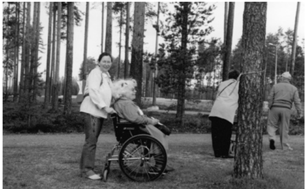
Härmässä vietetyillä kesäpäivillä ratkottiin luontopolun kysymyksiä.

Esteettömät toimitilat -hankkeen toteutuminen mahdollistaisi vaikeavammaisten henkilökohtaiset neuvontatapaamiset. Samoin neuvontapalveluihin on syytä liittää opastus sähköisestä asioinnista erilaisissa