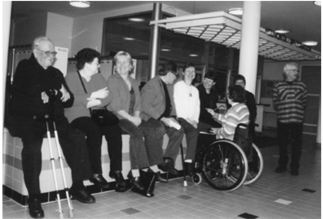
Verttaistuki on yhdistyksen luontainen voimavara.

Polioinvalidit ry painotti vuoden 2006 edunvalvonnassaan erityisesti seuraavia asioita: