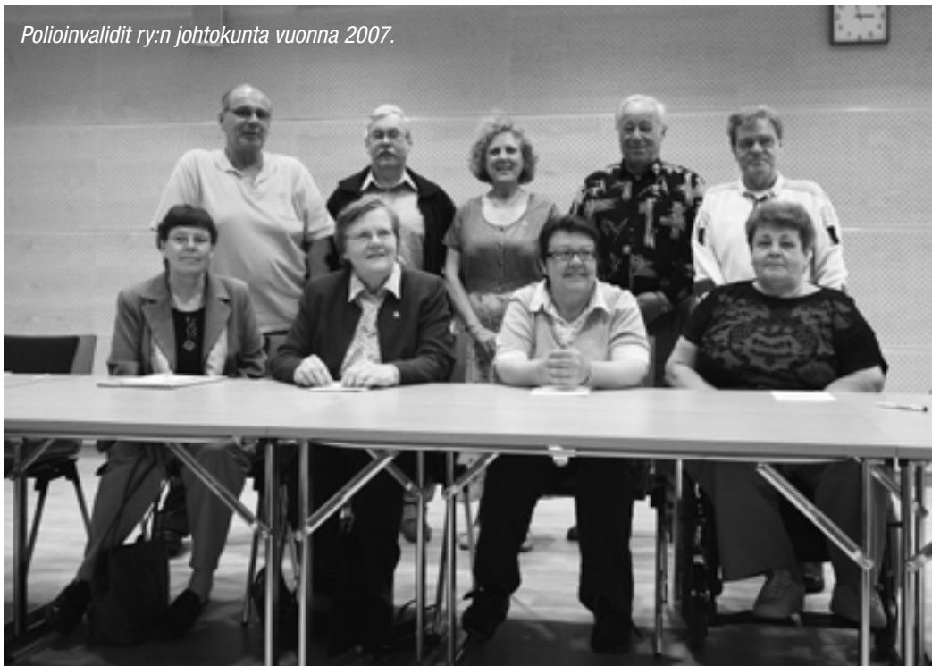
Polioinvalidit ry:n johtokunta vuonna 2007.

tutustua erilaisiin fysikaalisiin hoitoihin sekä tuttuihin että uudempiin liikuntatapoihin salivoimistelusta luontoliikuntaan. Näihin liikuntatapahtumiin osallistui yhteensä 124 (vuonna 2005: 103) jäsentä.