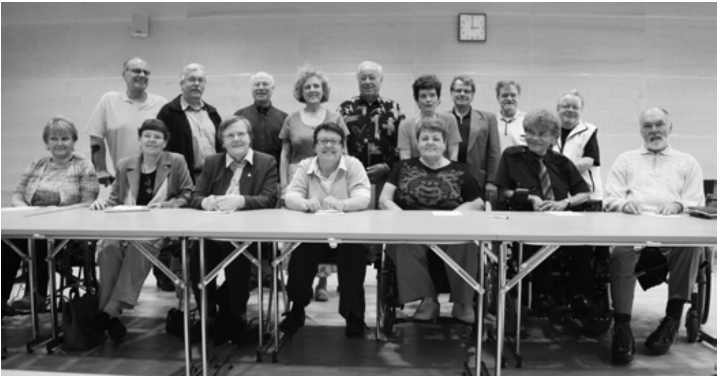
Suomen Polioliitto ry:n vuosikokousedustajisto.