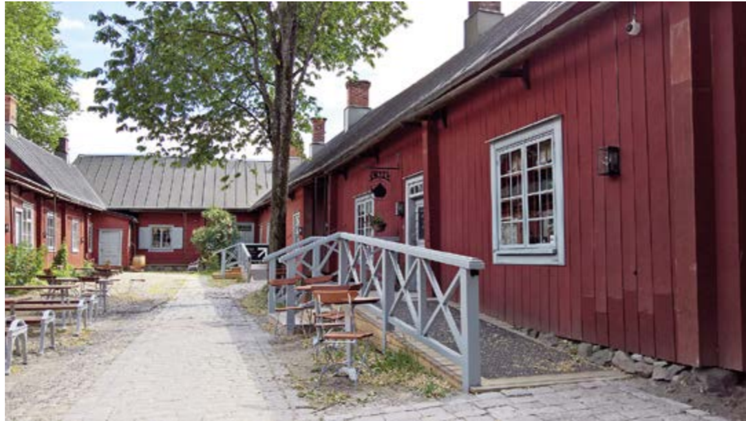
Apteekkimuseon sisäpiha ja toimiva luiska.

Tapaamiseen tultiin jo klo 11, koska paikkaan ei voinut tehdä ennakkoon pöytävarausta. Lounaspaikka on hyvin suosittu ja nytkin paikka alkoi vähitellen täyttyä. Ulko-ovella on kynnyks,