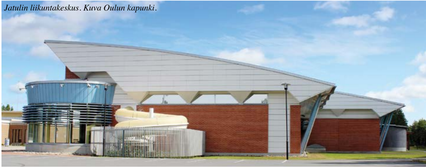
Jatulien liikuntakeskus.

P idimme jälleen jäsentapaamisen Jatulissa. Kokoonnumme 2-3 tuntia kerrallaan. Tilan vuokra on 20 euroa/tunti. Saamme järjestöavustusta tilan vuokraan Oulun Kaupungilta.