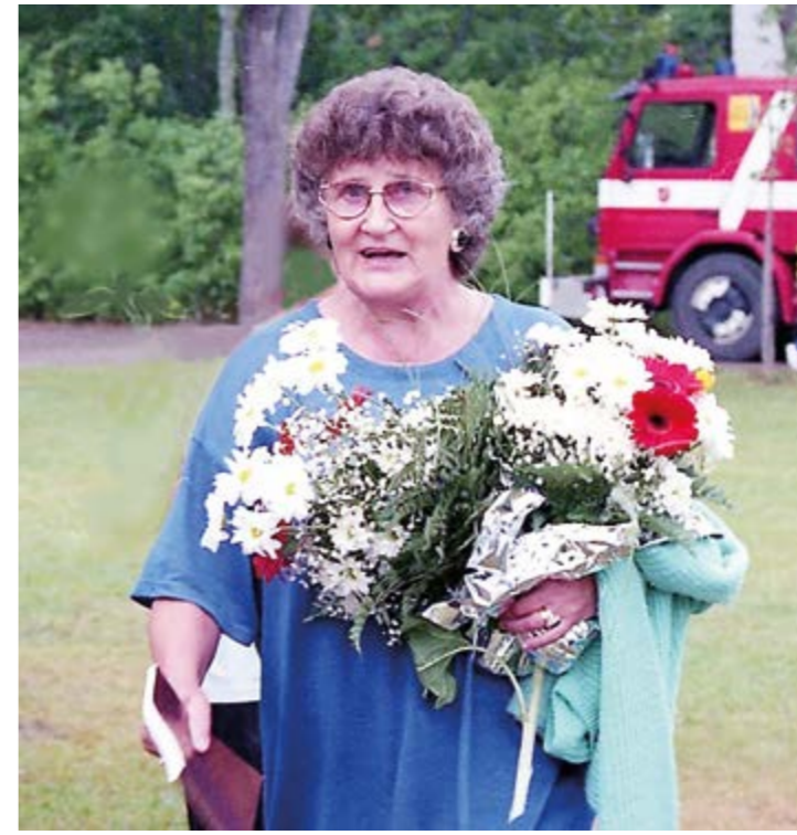
Kirkon kiroit –näytelmän ensi-ilta on onnellisesti ohi ja kuki-tettu ohjaaja voi huokaista helpotuksesta.

Sairastumistani surkutteli kuultuani moni läheinen sukulainen lähes päivittäin. Onnuin vahvasti, eikä halvaantunut jalkani kantanut yhtä hyvin kuin vasta pari vuotta aikaisemmin.