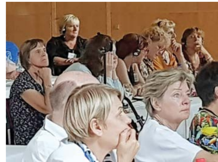
Osallistujamaiden kovin erilaiset toimintaympäristöt mieltäytyivät kokouksen osallistujia.