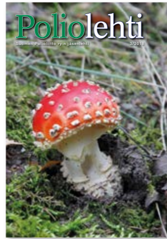
Kannen kuva AK