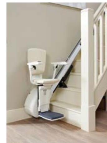
Tiitus HomeGlide Extra -tuoli-hissi on tarkoitettu suoriin portaisiin omakoti- ja rivitaloissa sekä pienkerrostaloissa. Hinta alkaen 5500 euroa.

seen tilaan milloin tahansa eikä tarvitse odotella rakennuksen peruskorjausta, jolloin tuntuu olevan muita tärkeämpiä remonttikohteita.