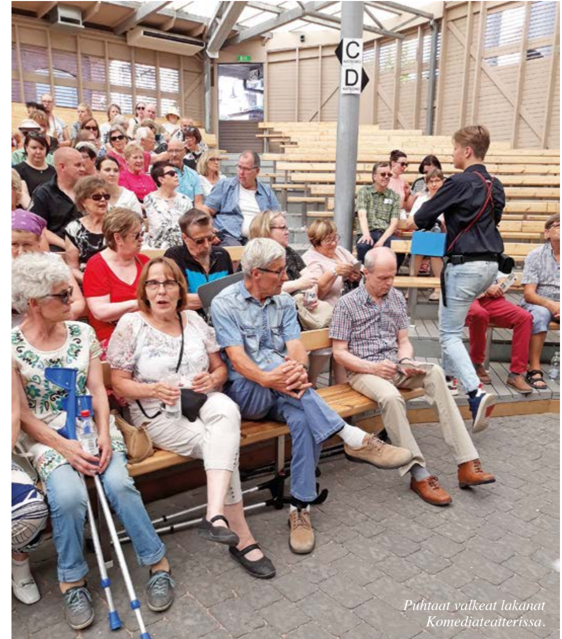
Puhtaat valkeat lakanat Komediateatterissa.

Syyskuun pimeinä iltoina puiden suhinassa kesän viime henkäys haikaa suloinen ja syksyyn katoava kuiskausta menneestä kesästä