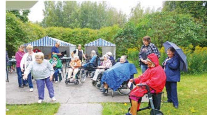
Kuinka ollakkaan: kesä helteet vaihtuivat sateeksi. Se ei yhdessäoloa häirinyt. Kaikki olivat oikealla asenteella mukana.

Kun hanat aukesivat siirrymme katoksien suojan seurustelevaan, laulamaan yhdessä ja erikseen. Ja odottamaan kokkimestareiden luomuksia: grillimakkaraa oikea asteisesti kuumana ja kuoreltaan sopivan ruskistuneena, muurikkalettujen ja kahvin valmistumisen tuoksua haistellen. Joko kohta saisi herkkua maistella?