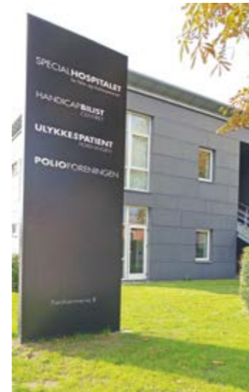
Roedovren erikoissairaalan tiloissa toimii myös polioliöjärjestö. Kerran kuukaudessa kokoonnutaan "poliokahvilaan" kuuntelemaan asiantuntijaluentoja. Kahvilatapaamiset ovat tanskalainen malli avokuntoutuksesta.

toimintaterapeuttien määrä ja osallistumisen kuntoutuksen suunnitteluun ja toteutukseen yllätti positiivisesti. Moniammatilliseen kuntoutussuunnitteluun osallistui toimintaterapeutin lisäksi lääkäri, fysioterapeutti, apuvälineteknikko, psykologi ja sosiaalityöntekijä. Tiimin tavoitteena oli kartoittaa kuntoutujan kokonaistilanne ja tarjota tukea tarvittaviin osaluiseisiin. Oli positiivista, että moniammatillinen tiimi pohtii yhdessä saman katon alla kuntoutujan kokonaistilannetta. Huomio kiinnittyi myös siihen seikkaan, että kuntoutujalla oli mahdollisuus talousneuvontaan.