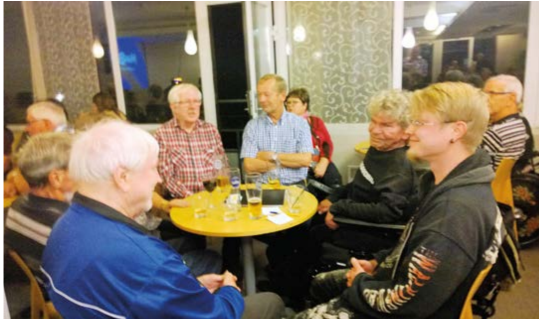
Laadukkaiden hoitojen välillä oli mukava kokoontua virkistäytymään ja vertailemaan kokemuksia. Osallistujat viihtyivät ja seuraavaa matkaa odotellaan jo innolla.

Hissiruljanssin ohitettuamme, pääsimme nauttimaan noutopöydän antimista. Eckerö linan ruuat ovat hyviä, mutta turhan usein samaa kaavaa toistavia. Saimme kuitenkin vatsamme täyteen, jonka jälkeen pyörähdimme laivan kaupassa.