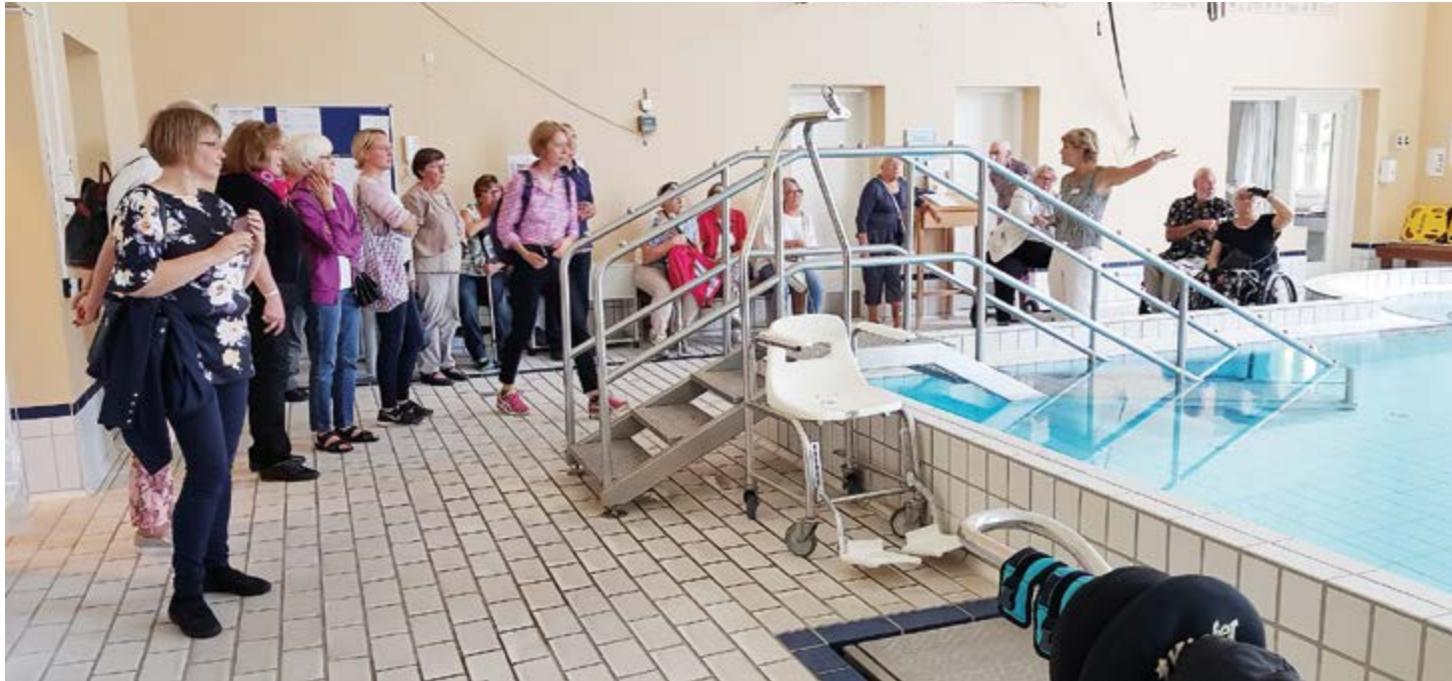
Allasosastolla on yksi allas. Veden lämpötila tuntui sopivan lämpöiseltä. Altaaseen pääsy näytti hankalalta.

Tanskalaisen poliojärjestön (PTU) ylpeydenaihe on polion ja onnettomuuksien vakavasti vammauttamia hoitava Erikoissairaala. Sairaala sijaistee lähellä Kööpenhaminaa Roedovressa, ja siellä annetaan vuosittain reilut 100.000 hoitoa. Sairaala palvelee pääasiassa pääkaupunkiseudun alueen asukkaita. Sairaallalla on pieni osasto myös Århusissa, joka vastaa muun kuin pääkaupunkiseudun alueen vastaavasta toiminnasta.