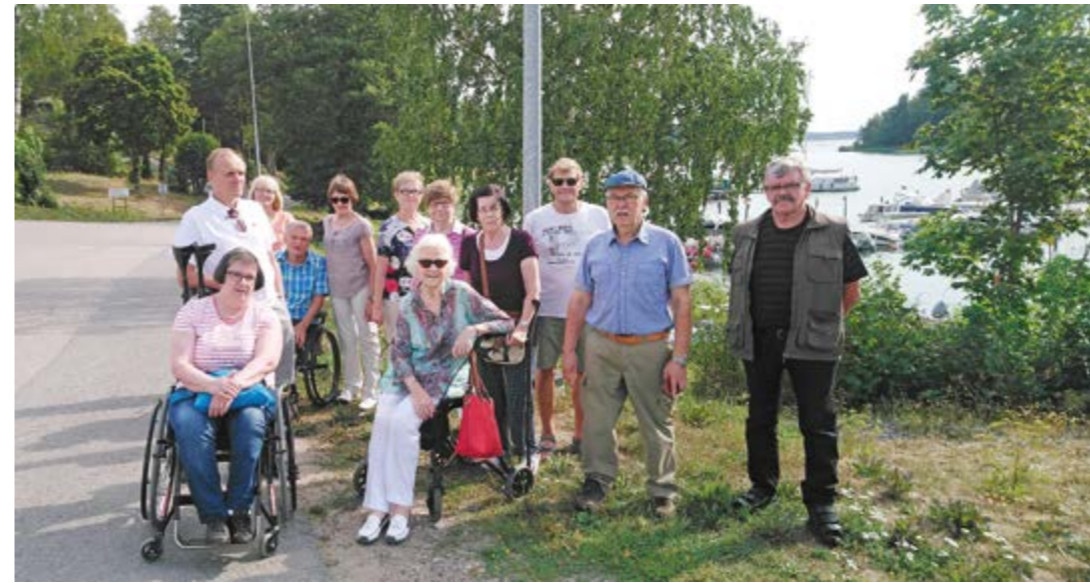
Osaston retkeläiset Taalintehtaalla ryhmäkuvassa.

Sauvon kirkolta suunnattiin kohti Paimiota ja Käsityömusio