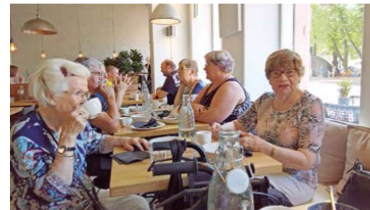
Lounas merkeissä Fontana Cafessa.

taloustieteen professori Pehr Kalm perusti alueelle hyötypuutarhan. Kasveja hän toi mm. Venäjältä ja Amerikasta.