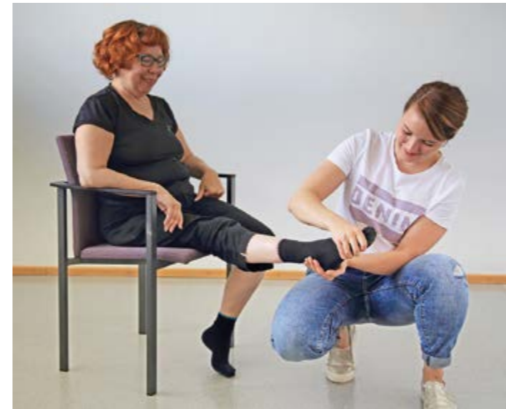
5. Passiivinen nilkan ojennus ja koukistus.