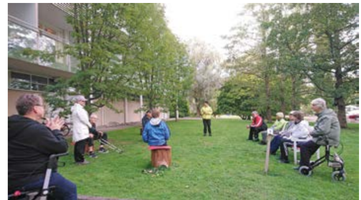
Ohjelmassa oli luonto kuntosalina.

Keskiviikkona aamupalan jälkeen meidän ryhmällämme oli ohjelmassa pakuhuone. Tällaista ei oltu vielä koskaan kokeiltu. Ryhmämme suljettiin liikun-