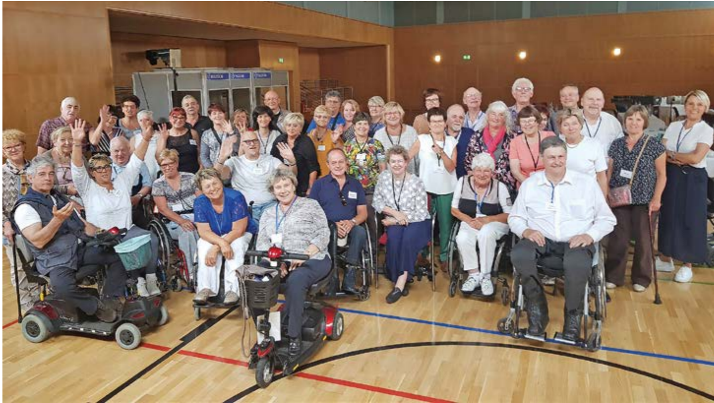
Kokouksessa toiminnanjohtajamme sai erikoistehtävän ja pyynnön toimia virallisena valokuvaajana ja minä tunnettuna äänenkäyttäjänä kokosin porukkaa yhteen kuvauksia varten. Toivottavasti kuvista tuli hyviä ja tulihan taatusti!

Euroopan Poliunionin (EPU) varsinainen kokous pidettiin 15.-17. kesäkuuta 2018 Rheinsburgissa, Saksassa. Kokouksessa osallistujat toivoivat yhdessä löytävänsä ratkaisuja, joilla Euroopan polion sairastaneet kaikki saisivat tarvitsemansa tiedon polion myöhäisoireista ja avun selviytymisensä tueksi. Euroopan Poliunioniin kuuluu tällä hetkellä 31 järjestöä 21 eri maasta. Kokouksessa oli edustajia 15 eri maasta.