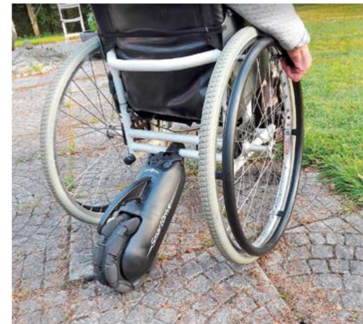
Ajomatka on yhdellä latauksella noin 20 km, eli kuljet helposti yhdellä latauksella koko päivän.