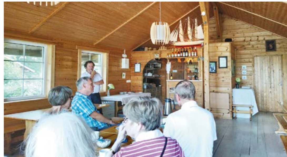
Tammiluoto on omenatila, jolla aloitettiin viinitilatoiminta vuonna 1996.

Miilaa. Miila sijaitsee Paimion keskustassa Vistantien varrella, harmaassa funkistalossa. Käynti museoon on Opintotien ja Kirkakujan kautta. Miilaan pääsee esteettömästi sivuovesta, jonne johtaa luiska. Museon toiseen kerrokseen on porrashissi, joka on portaan tason yläpuolella kiinteä johdettu pitkin kulkeva tuoli. Tuoliin täytyy pystyä siirtymään ja siinä istuessa on oltava hyvä tasapaino. Käsiyöihmissä kiinnostivat esillä olevat erilaiset käsityöt.