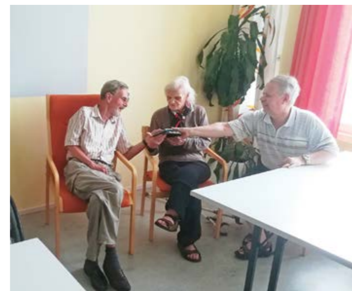
Vertaistukea ja hyvää mieltä.