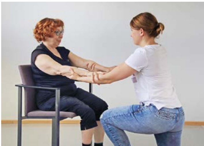
2. Passiivinen käden eteen ja ylös nostaminen.