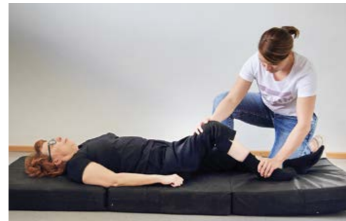
6. Lonkan passiivinen koukistaminen selinmakuulla.