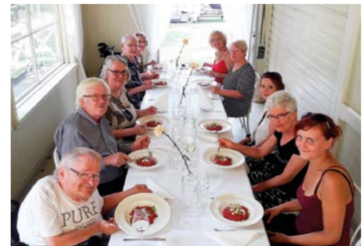
Lähituotteista valmistettu lounas Viikinsaarella.