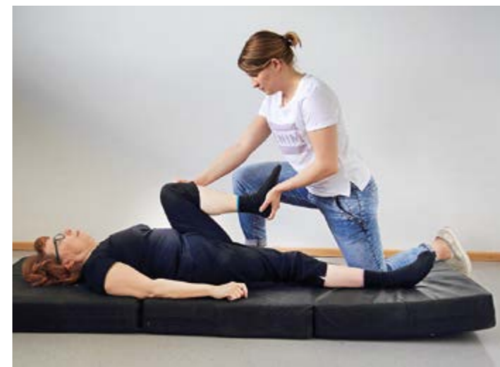
7. Polven passiivinen koukistaminen selinmakuulla.