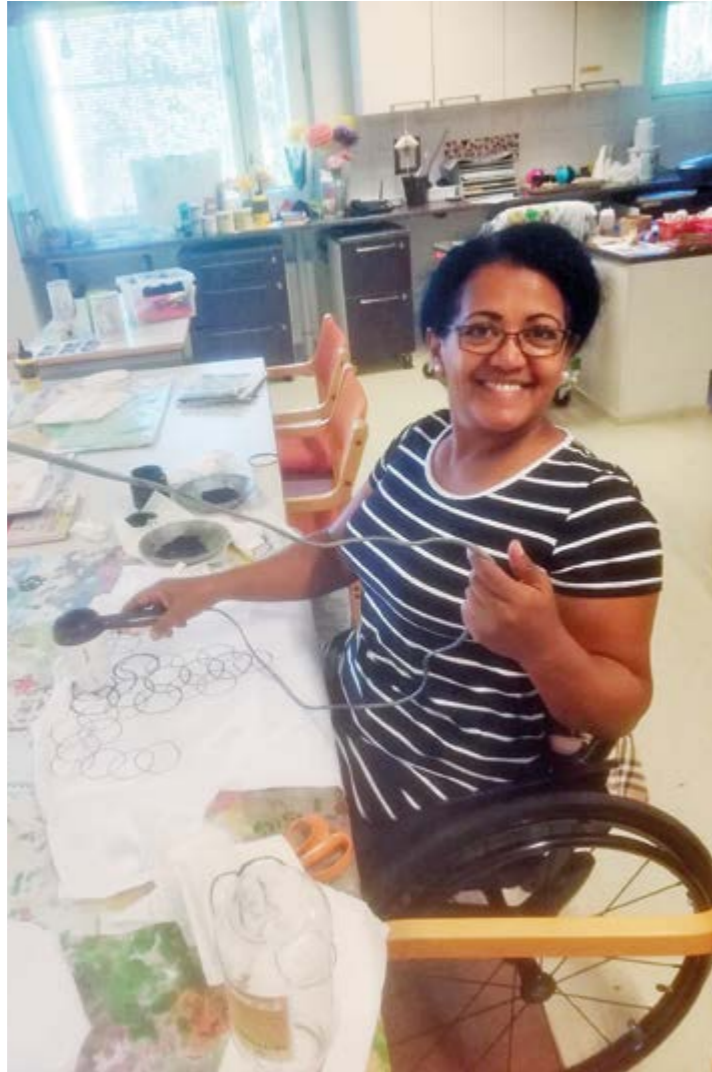
Yodit kankaanpainannassa. Tulossa hieno t-paita.

Tarkistimme oman junamme lähtöraiteen ja ajan, jonka jälkeen lähdimme etsimään rai-