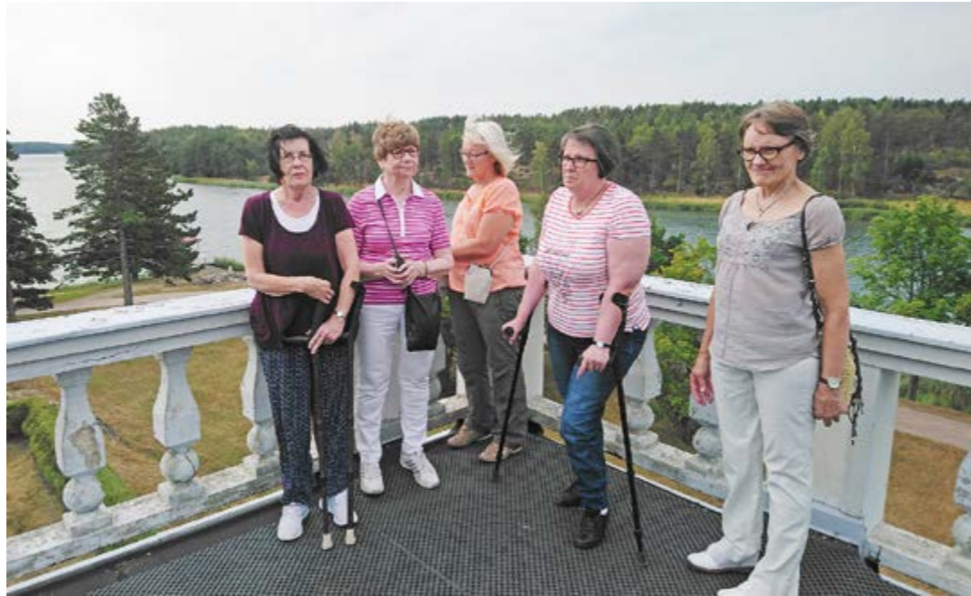
Varsinaissuomalaisia retkeläisiä parvekkeella.

Söderlångvik sijaitsee Kemiönsaarella, 88 km Turusta. Kartano aukesi vasta klo 11 ja koska olimme lähteneet aikaisin, meillä oli aikaa kierrellä Taalintehtaan keskustaa ennen kartanoon menoa. Pysähdyimme jaloittelemaan meren rantaan rantatien varrelle ja otimme samalla retkeläisten yhteiskuvan. Täällä meren äärellä ei ollut niin kuuma kuin, mihin oli totuttu edeltävinä viikkoina, lämpötila oli varmaan alle 25 astetta. Turun suunnalla oli samaan aikaan monta astetta lämpimämpää.