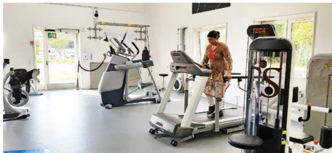
Hyvinvarusteltu kuntosali toimii niin kuntosalina kuin vertaistuentukikohtanakin.

Roedovren erikoissairaallalla, kuten tanskalaiset sairaalaa kutsuvat, on sopimus Tanskan