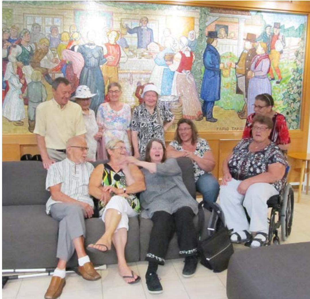
Savolaisten kesäretki suuntautui Kuopion Rauhanlahden kesäteatteriin. Musiikkikomedia kertoi Pertti, Spede Pasasen elämästä.