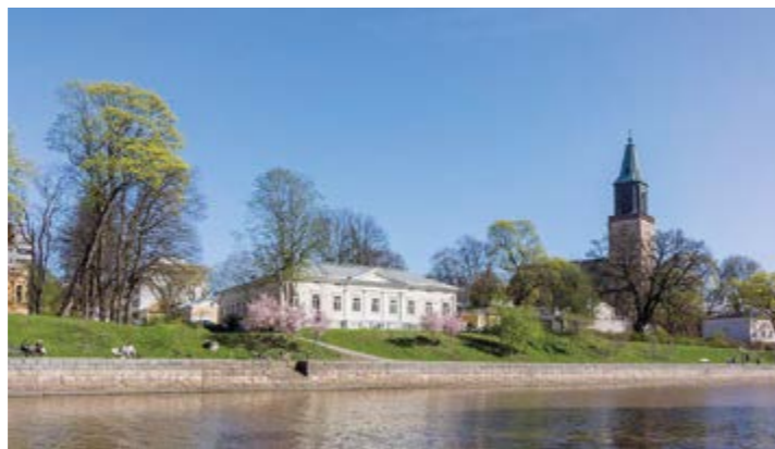
Hus Lindman on perusteellisen kunnostuksen myötä palautettu lähes alkuperäiseen asuunsa.

mutta avustajan kanssa selviää ovesta. Ruoka haettiin noutopöydästä. Pyörätuolilla tämä oli haastavaa, koska astiat olivat melko ylhäällä. Ruoka oli hyvää ja noutopöydästähan voi aina hakea lisää ruokaa. Fontana sijaitsee Aurakadun ja Linnankadun kulmassa.