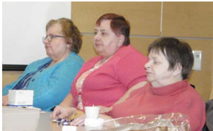
Kerholaisia keväältä 2017. Kerhossa on mahdollista keskustella arjen iloista ja suruista vertaisten kanssa.

Kuuma kesä puhututti kovasti ihmisiä. Osa väestöstä oli kärsinyt kuumuudesta ja osa oli siitä