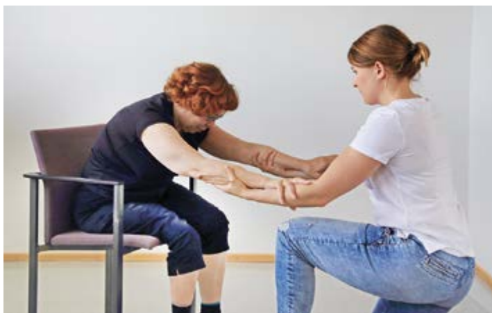
1. Avustettu kumartuminen tuolilla istuen.