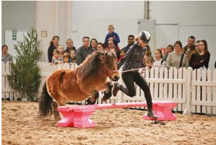
Vuoden 2017 messuilla shetlanninponit esittelivät poniagilityä.

Vuoden 2018 Hyvinvointimessut ovat lauantaina 13.10.2018 klo 10 - 16 Energia Arenalla Myyrmäessä, Rajatorpantie 23, 01600 Vantaa.