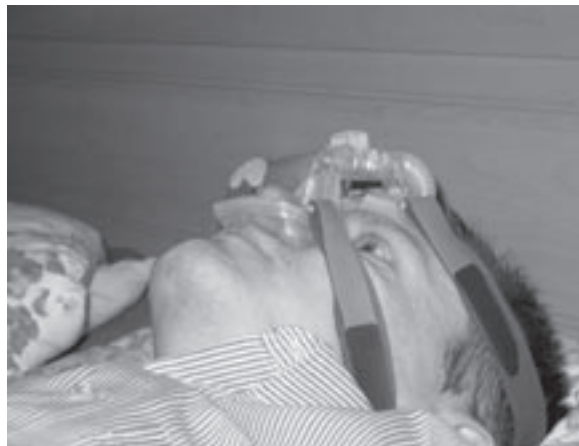
NenäCPAP-hoito on yksi tehokkaimmista uniapnean hoidoista.

Hankkeen tavoitteena on, että osallistujat voivat määritellä ja toteuttaa itselleen sopivan painonhallinta ja fyysisen kunnan kohentamishankkeen niin, että uniapnea-oireilu helpottaa. Uniapnean hoidossa on painonhallinnalla tärkeä merkitys sekä oireiden hallinnan että taudin ennusteen kannalta. Liikunnan lisääminen luo mahdollisuuksia painonhallintaan pitkällä tähtäyksellä. NenäCPAP-hoito on usein tehokasta ja valikoiduissa tapauksissa taudin hoitoon käytetään hammaskiskotusta tai kirur-