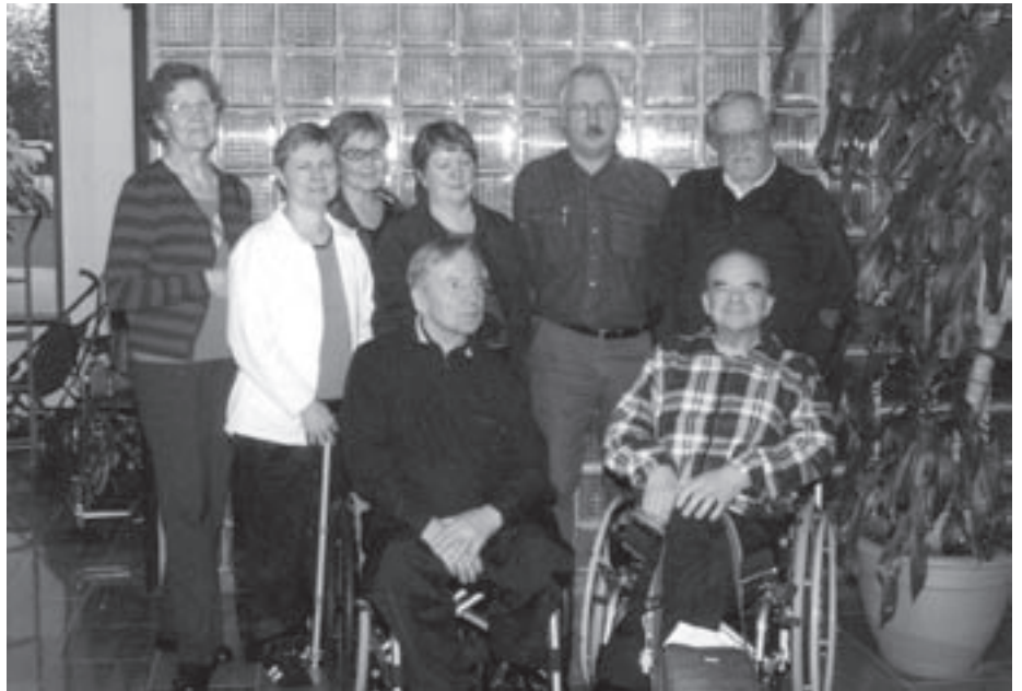
Pohjois-Suomen osastolle valittiin Rokualla myös uusi johtokunta.