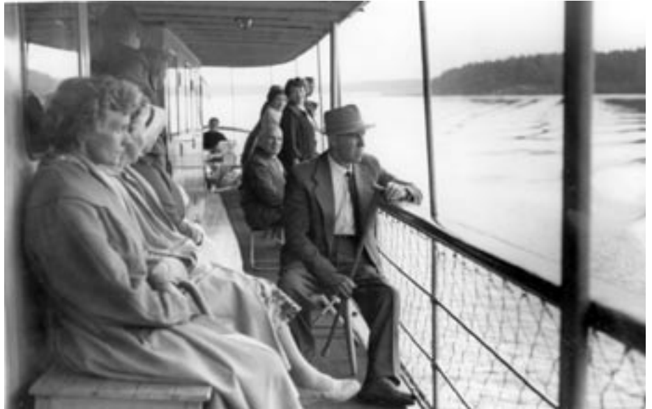
Polioretkeolijat laivaristeilyllä Saimaan aalloilla kesäpäivillä 1958.

Sunnuntaina käymme tutustumassa Marjolaan, Etelä-Saimaan Invalidit ry:n mainioon kesäpaikkaan.