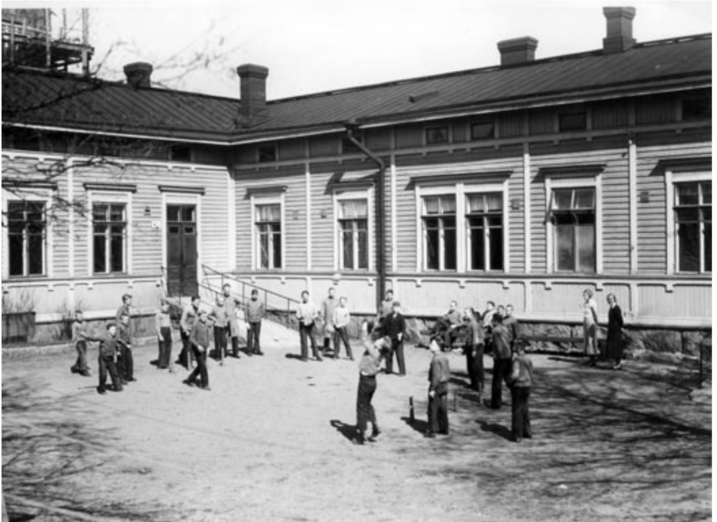
Raajarikkoisten huoltolaitos, Ensilinja 5 - Alppikatu 1