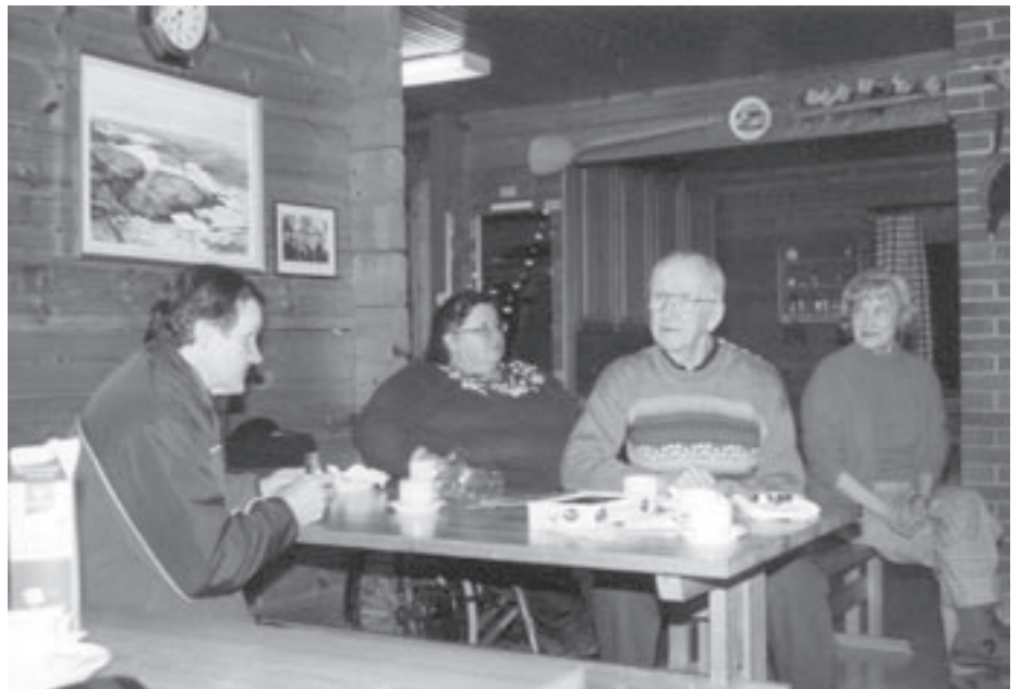
8.2.06 Oulun kerho kokoontui kesäkoti Irjalassa.

Nyt kokoontumisia on ollut jo neljä ja mukaan on tullut vähitellen aina uusia jäseniä, viimeksi meitä oli 17 vaikka pakkaneen ja flunssa pitikin muutamat kotona. Tapanani on lähettää tekstiviestimuitus muutamaa päivää ennen kerhoiltaa kaikille aikaisemmin mukana olleille. Tämän kevään kokoonnumme Oulun Invalidien Yhdistyksen omistamassa Kesäkoti Irjalassa, Mustasaarentie, Hietasaari, Oulu. Tilat ovat viihtyisät ja riittävän helppokulkuiset. Kahvitte-lun, makkaranpaiston ja arvanmyynnin ohessa olemme keskustelleet monista polioon ja yhdistykseen liittyvistä asi-