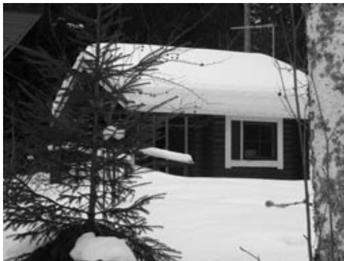
Vielä maaliskuussa Kaislarannan mökit verhoutuivat paksun lumivaipeen alle.

- Epämiellyttävien asioiden määrä oli 52 tunnin sähkökatko. Selvisimme siitä kylläkin ihan hienosti. Mieluiset yllätykset ovat tulleet eri kuntien kanssa solmimistamme sopimuksesta. Kaislakoti on saanut